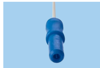
Connettore J = 2 mm