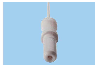
Connettore K = 1.5 mm

71005-K/C/12 ● Prodotto ● Kit colore ● Lungh. cavo ● Elettrodi in busta ● Connettore