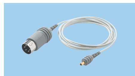
Ambu® Neuroline™ Cavo concentrico

Il cavo è schermato, flessibile e può essere riutilizzato fino a 2000 volte.